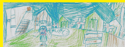
参加した子どもが楽しい思い出を...